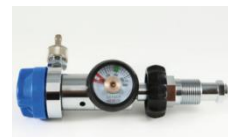
Riduttore di pressione