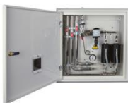
Sistema di evacuazione gas anestetici a venturie