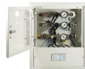
Pannello di emergenza con allarme