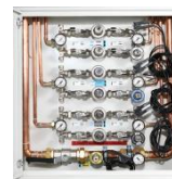
Quadro di riduzione di II° stadio mod. WR con allarme