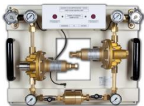
Quadro di riduzione 1° stadio ad inversione automatica