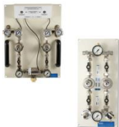
Unità di riduzione a doppio stadio ad inversione automatica