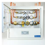
Quadro d'intercettazione di area con allarme