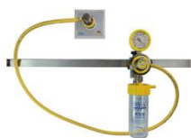
Barra porta accessori